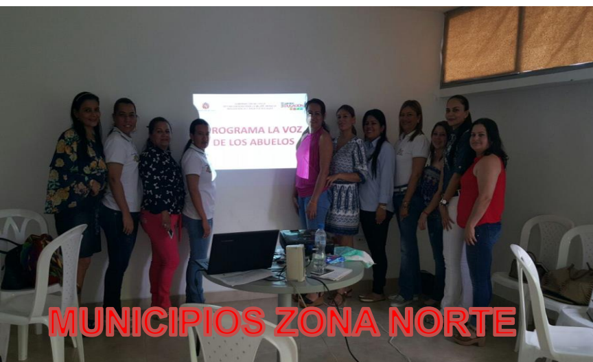
MUNICIPIOS ZONA NORTE