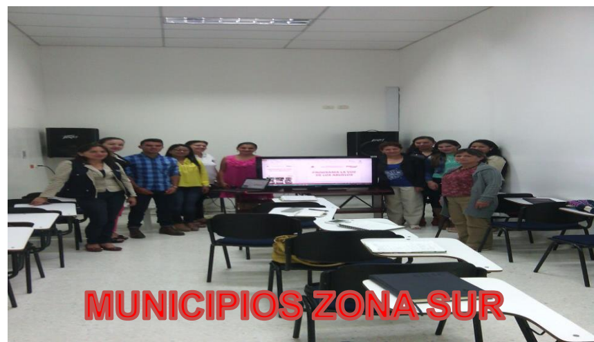
MUNICIPIOS ZONA SUR