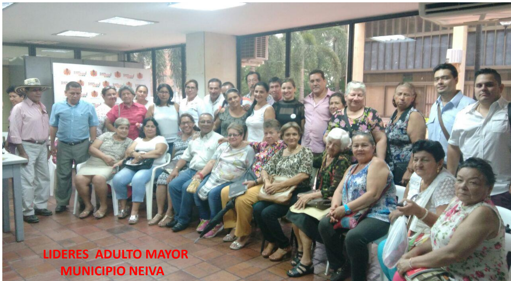
LIDERES ADULTO MAYOR MUNICIPIO NEIVA