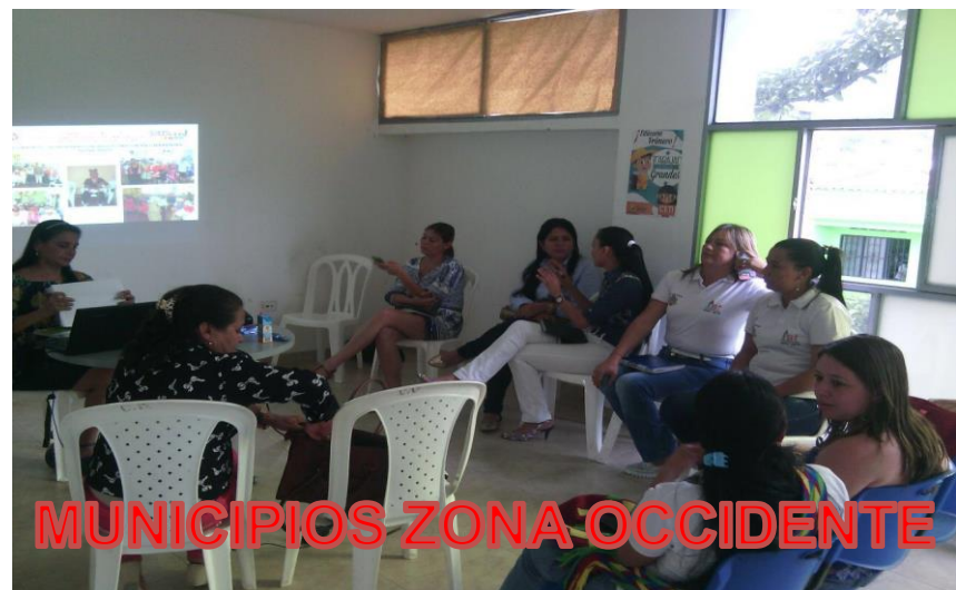
MUNICIPIOS ZONA OCCIDENTE