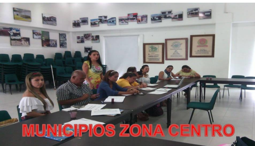
MUNICIPIOS ZONA CENTRO