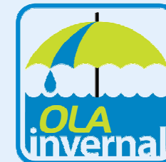
MODELO DE PAGO CREDITO OLA INVERNAL MEDIANO PRODUCTOR