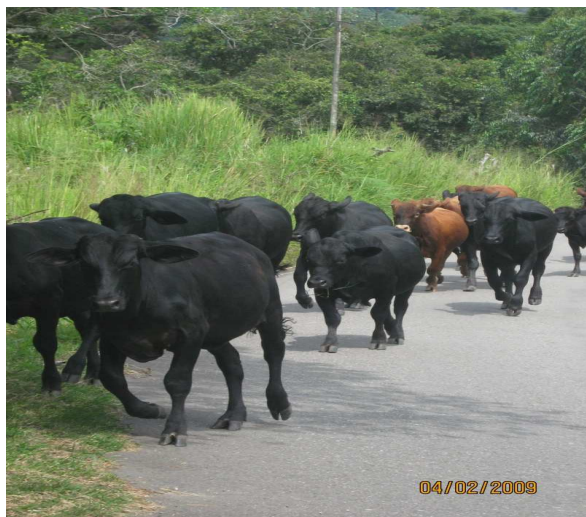
Foto: Programa de mejoramiento bovino Raza Aberdeen Angus Municipio de Gigante

productores. Se realizaron 7.594 inseminaciones confirmadas, atendiendo a 811 usuarios. Se han desarrollado importantes nichos de producción de leche en el centro, occidente y sur en predios de tamaños pequeños y medianos, con un alto componente de manejo administrativo, nutricional y sanitario. En la producción de carne, el mayor desarrollo se ha observado en las zonas de clima medio y frío con ganaderías de razas especializadas con aberdeen angus, brangus, normando, simmental.