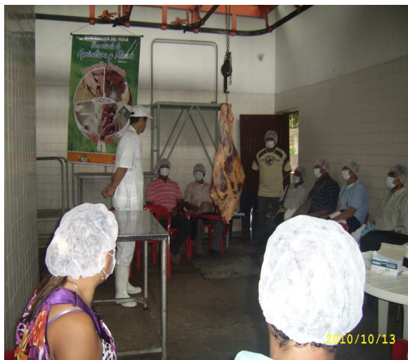
Foto: Capacitación práctica en Desposte, Cortes, Manejo y Usos de la Carne de res brindada a despostadores y cortadores de carne del CPGA Noropita para Municipios de Baraya, Tello y Alpujarra.