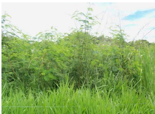
Foto: Programa de mejoramiento de praderas -sistema silvopastoril. Municipio de Garzón

Se hizo énfasis en los productores para su concientización en la necesidad de cultivar, almacenar y conservar forrajes en sus diferentes formas para el suministro de estos en las épocas de carencia que se presentan en las zonas norte y centro, debido a los fuertes veranos. De igual manera se ha capacitado a los productores en el uso de subproductos, bloques multinutricionales y residuos de cosecha para la suplementación periódica o permanente de los animales.