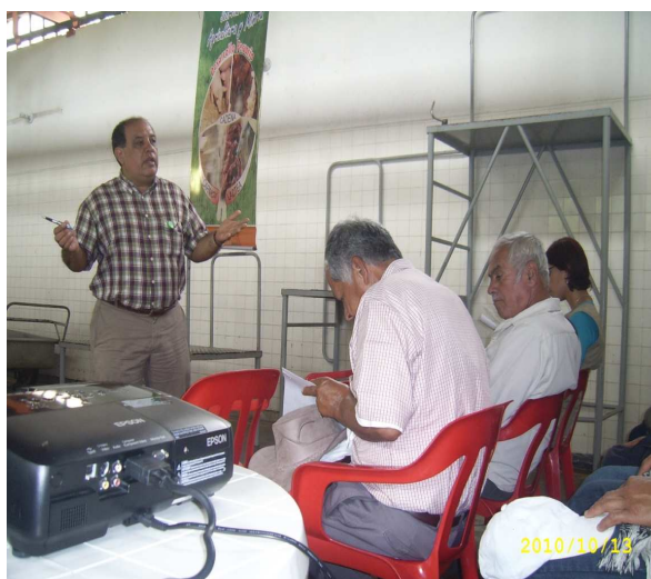
Foto: Reunión capacitación teórica a productores Municipio de Baraya.