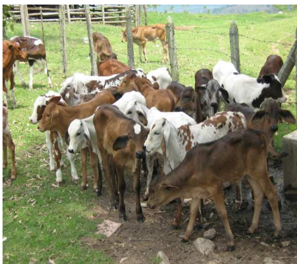
Foto: Programa de Mejoramiento Genético. Crías obtenidas Usuario. Municipio de Elías.

Con el uso de la herramienta de la inseminación artificial a término fijo, se procuró el mejoramiento genético de la ganadería en predios de pequeños y medianos productores. Mediante el convenio Específico No. 0019/2010- IICA-Dpto. del Huila, celebrado entre el COMITÉ DE GANADEROS DEL HUILA, SENA , SEDAM y ejecutado por el FONDO GANADERO DEL HUILA, se realizó la inseminación de 7.594 vientres de acuerdo al diagnóstico inicial, selección y caracterización determinadas en el protocolo del convenio. Este programa se realizó en 36 municipios del Departamento, beneficiando a 812 productores y con un resultado final del 59% de eficacia.