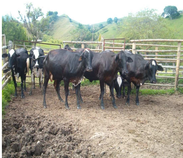
Foto: Programa de repoblamiento bovino - lote de novillas de vientre Municipio de Paicol.

Este programa no tuvo desarrollo en el año 2010, por los diferentes cambios en la política crediticia del Banco Agrario. Se han realizado múltiples gestiones para lograr la continuidad del programa o su liquidación.