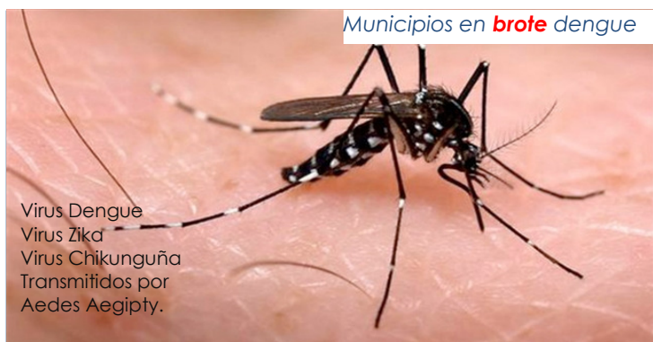
Municipios en brote dengue

Virus Dengue Virus Zika Virus Chikunguña Transmitidos por Aedes Aegypti.