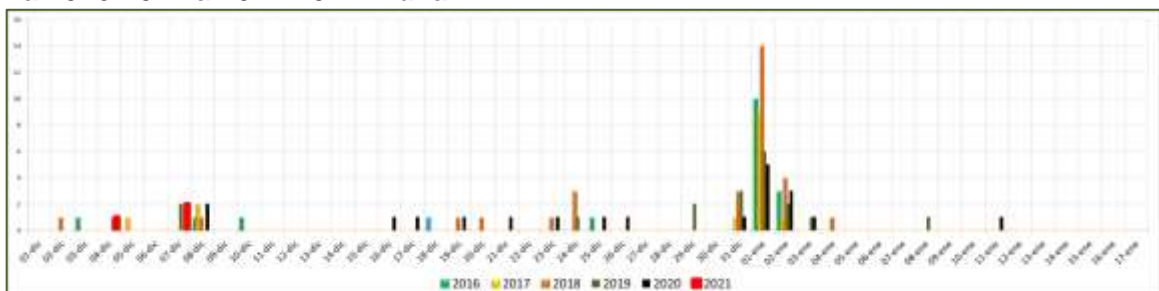
Figura 1. Comportamiento de los eventos de lesiones por pólvora, según día de ocurrencia. Temporada decembrina 2016-2017 a 2021-2022. Huila

Con el propósito de observar la tendencia de los días en los cuales se presentan los eventos de lesiones por pólvora, se presenta a continuación el siguiente gráfico.