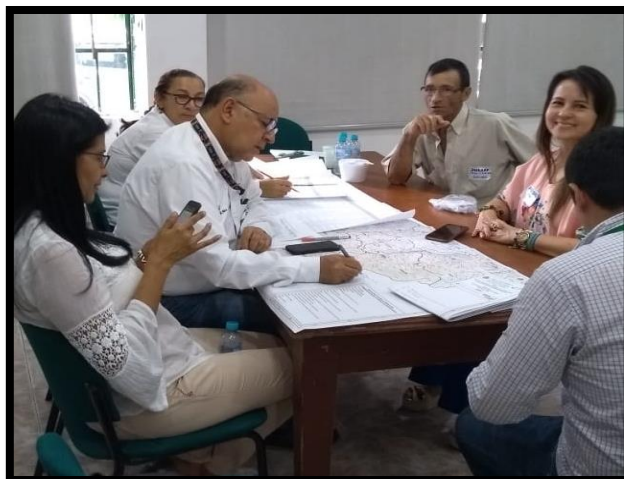
Mesa # 2