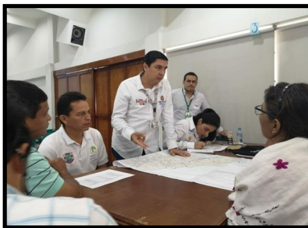
Mesa # 3