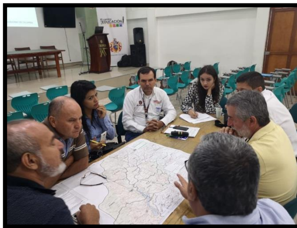
Mesa # 1