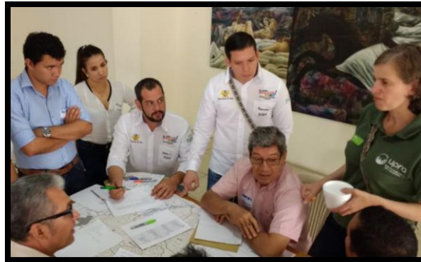
Grupo # 3