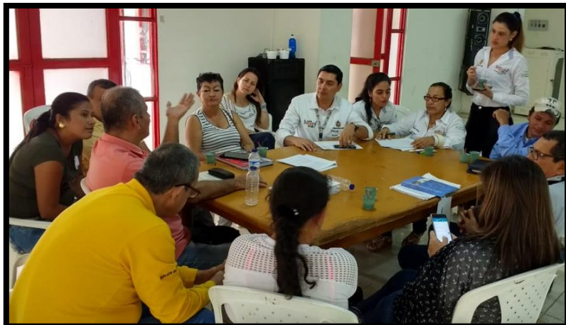
Grupo # 1