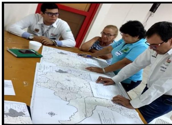
Grupo # 4