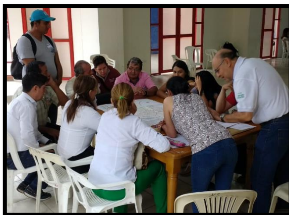
Grupo # 2