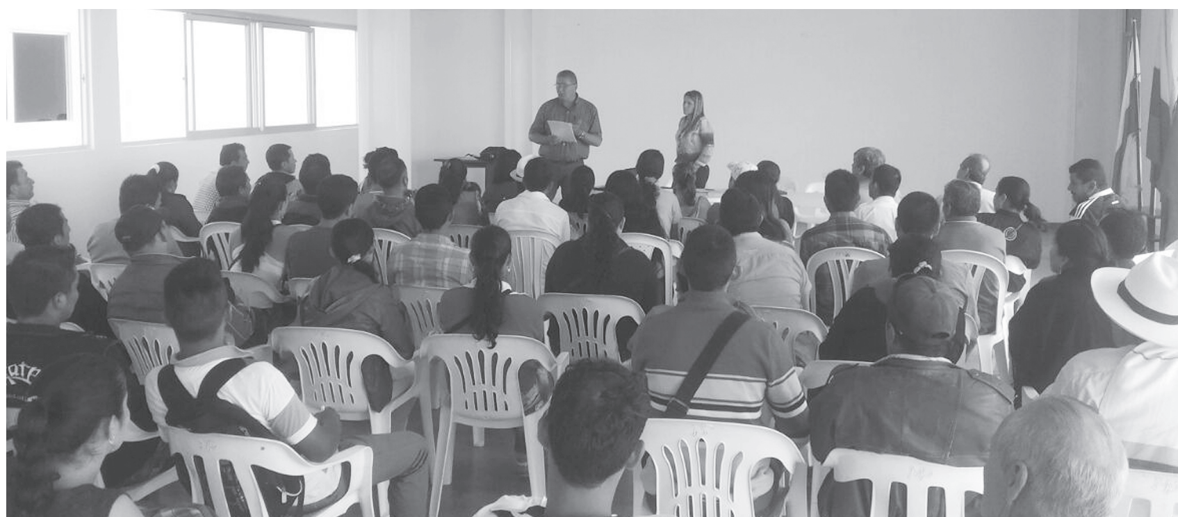
El Director de Fonvihuila en compañía de alcaldes del departamento se reunieron con el Ministro de Vivienda, Ciudad y Territorio y se confirmó la viabilización de algunos proyectos para el Huila.

El Fondo a través de su equipo de profesionales diseñó un efectivo programa de asesoramiento para los municipios, en especial para los alcaldes para que de esta manera puedan presentarse en la oferta actual de viviendas gratis que aún quedan en el Ministerio de Vivienda, postulando proyectos concretos y que cumplan con todos los lineamientos exigidos en las convocatorias nacionales. De esta manera se mitigará el déficit de vivienda nueva en el departamento.