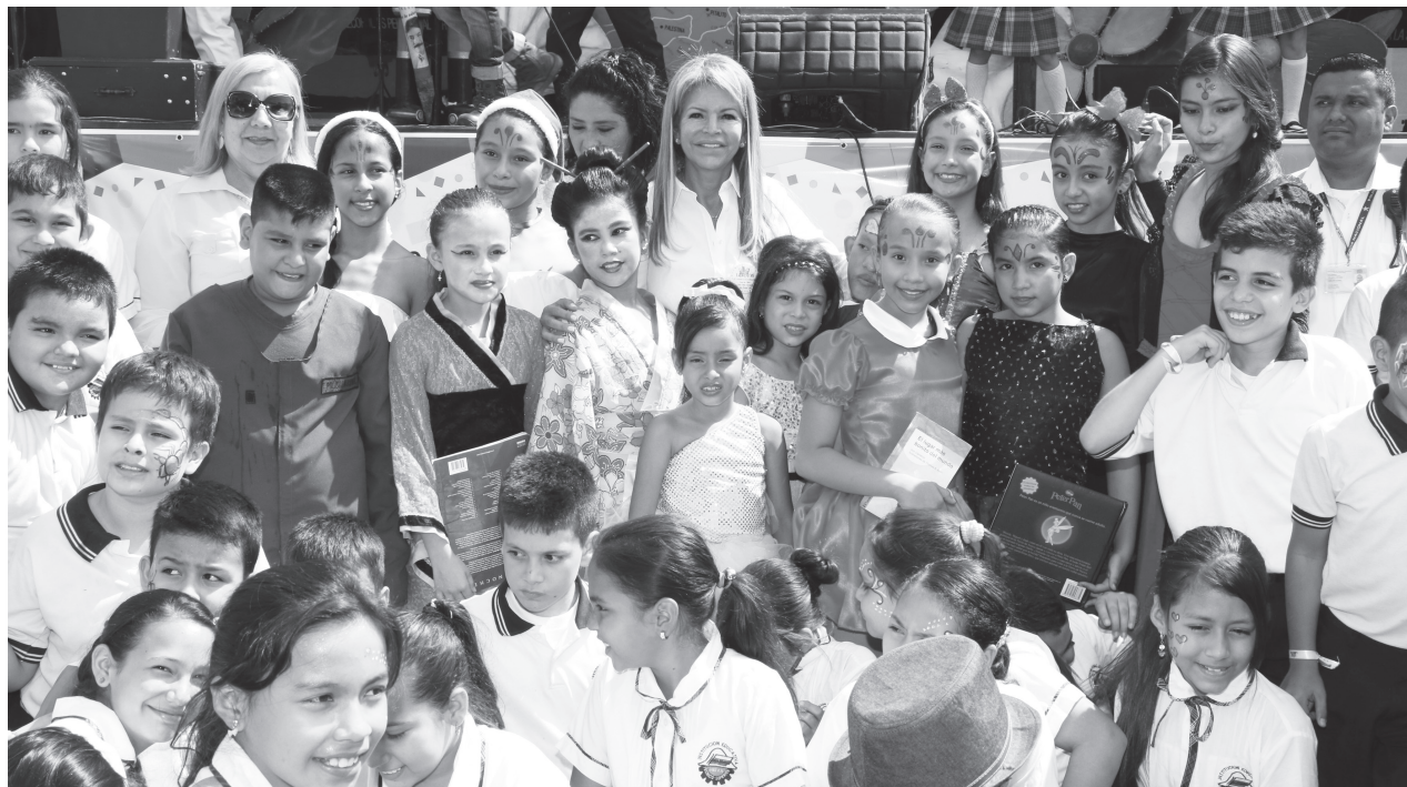
La Gestora Social comparte con los niños y niñas en las sedes educativas.