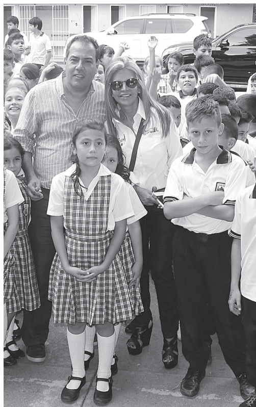
A las sedes educativas de Palermo llegó la Gestora Social del Huila.

y sueño durante la época de campaña que es hoy una realidad gracias al invaluable apoyo y vinculación de los opitas.