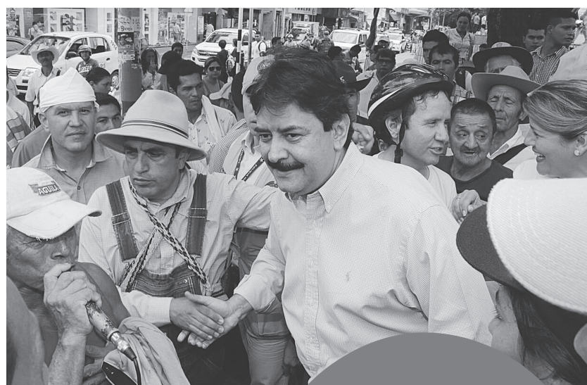
En Neiva, el mandatario seccional dio a conocer a los manifestantes del ‘Día Mundial contra las Represas’ que el Gobierno Nacional garantizaba que no habrá más hidroeléctricas en el Huila.

“Por medio de la presente, una vez realizadas las consultas dentro del Gobierno Nacional y los Ministerios correspondientes, me permito ratificar lo expresado verbalmente