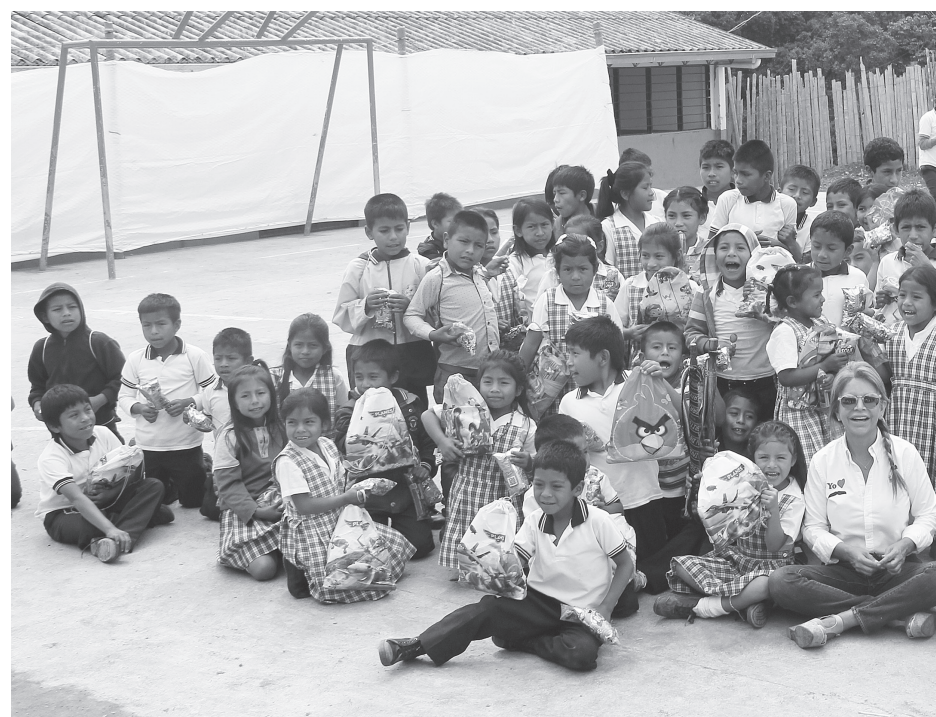
La Gestora Social visitó el resguardo indígena Potrerito en La Plata y compartió con la guardia escolar.

La zona rural de los municipios de Rivera, Elías, Acevedo, La Plata, Timaná y Palermo han sido los epicentros de la entrega de paquetes escolares.